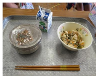
7月から具だくさんの「お椀一品」