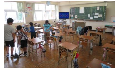
当番以外の子は、教室・廊下をかんたん掃除中。