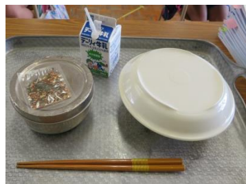
新しいフードカバーが届くまで、お皿で代用