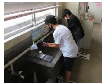
当番以外の子ども手洗いを徹底