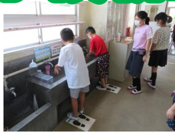
給食当番から手洗い