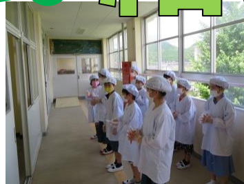
各階の給食室で受け取り