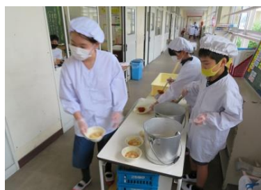
廊下から教室に運びます