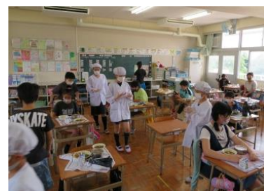
教室で配ぜんを待つ