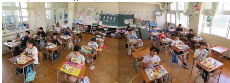
子どもたちは、教室前面を向いて、無言でもくもくと食べます