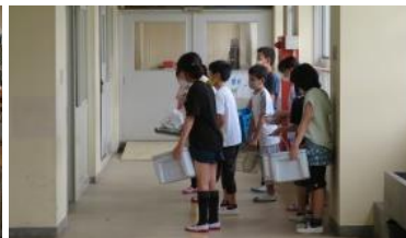
各階の給食室に戻します