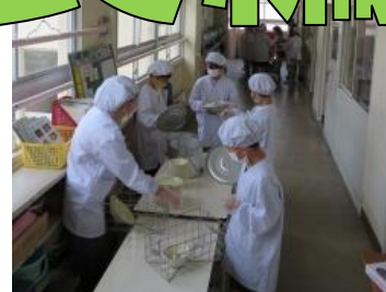
廊下で配ぜんをします