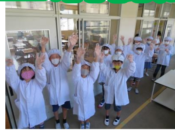
全員使い捨て手袋装着